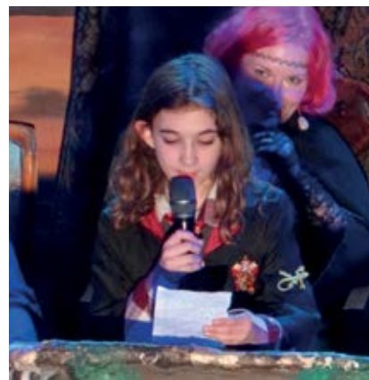
Siegerin des Goldenen Federkiels 2023